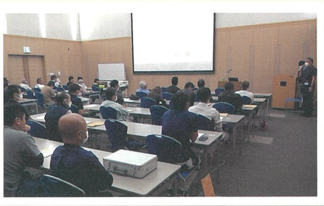
※講習会画像はイメージです。

※ご加入者の皆様のご協力がなければこの一人親方労災保険制度は成り立ちません。 [元請会社で受講しているから受けなくていい]という訳ではありませんので、皆様のご理解とご協力のほど何卒よろしくお願い申し上げます。